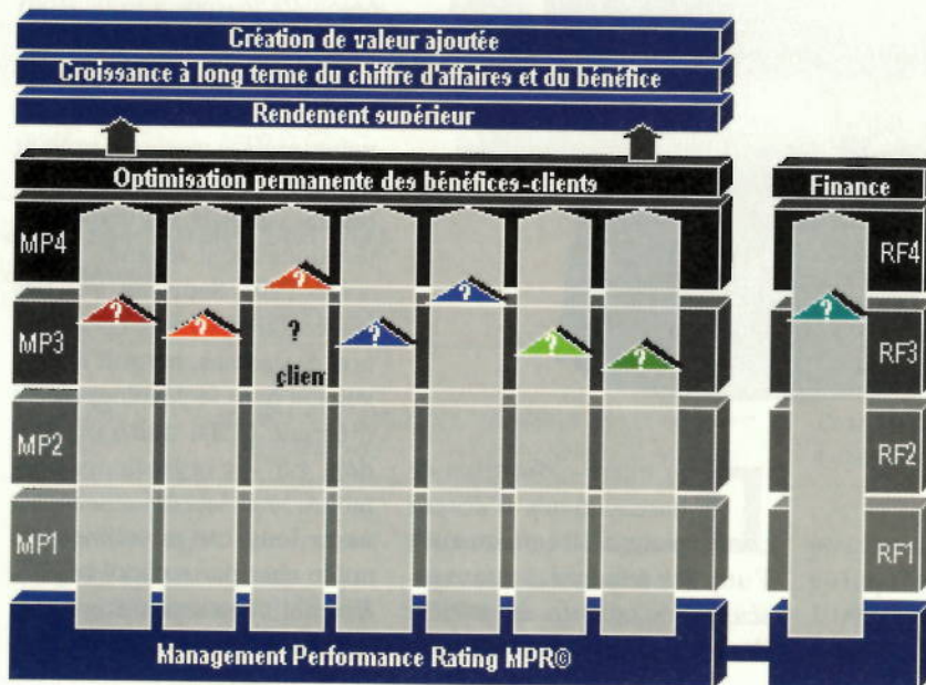
Figure 3 Le Light-Rating pour tout savoir en un coup d'œil

Technology, Consulting, Studies (Tecast) Route des Arsenaux 15 CH-1700 Fribourg http://www.tecost.ch